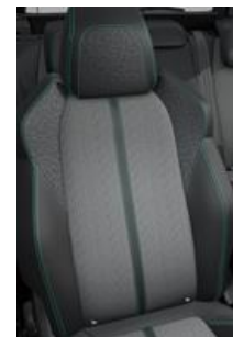
Tapicerka półskórzana Colyn Mistral