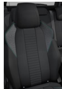
Tkanina Pneuma Mistral