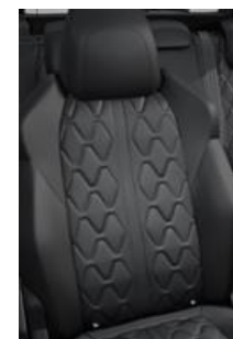
Tapicerka skórzana Nappa Mistral