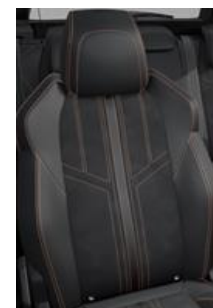
Tapicerka półskórzana Mistral + Alcantara