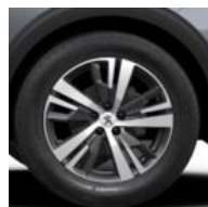
18" 'Detroit' Storm Grey