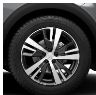
18" 'Detroit' Onyx Black