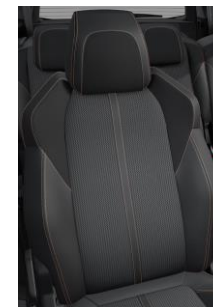
Tapicerka półskórzana Belomka Mistral