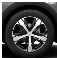
18" 'Los Angeles'