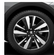
19" 'San Francisco'