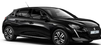
Czarny Perla Nera